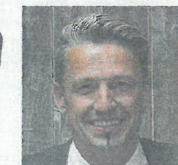
W. Aigner, Haus der Schlösser: „Mehr Anfragen.“