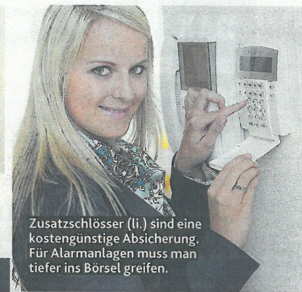
Zusatzschlösser (li.) sind eine kostengünstige Absicherung. Für Alarmanlagen muss man tiefer ins Borsel greifen.